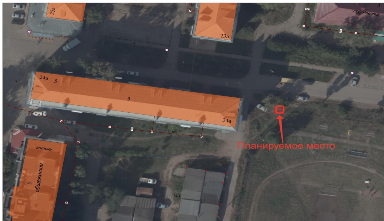
Схема размещения сооружения по ул. Кузнецкая (рис.5)