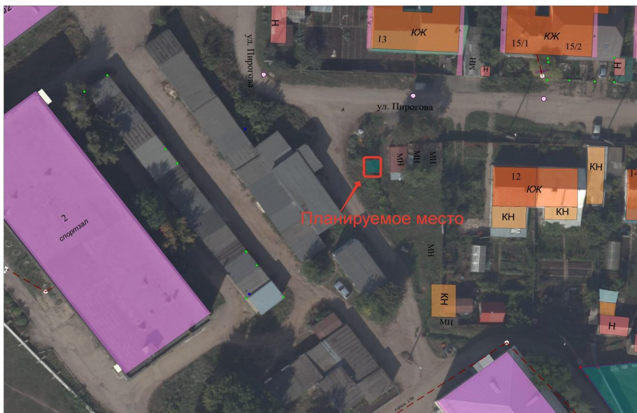
Схема размещения сооружения по ул. Пирогова (рис.3)

Площадки под № 2 и №3 (ул. Герцена и ул. Кузнечная) являются альтернативными (взаимозаменяемыми), одна из которых запланирована в работу, на усмотрение согласующих.