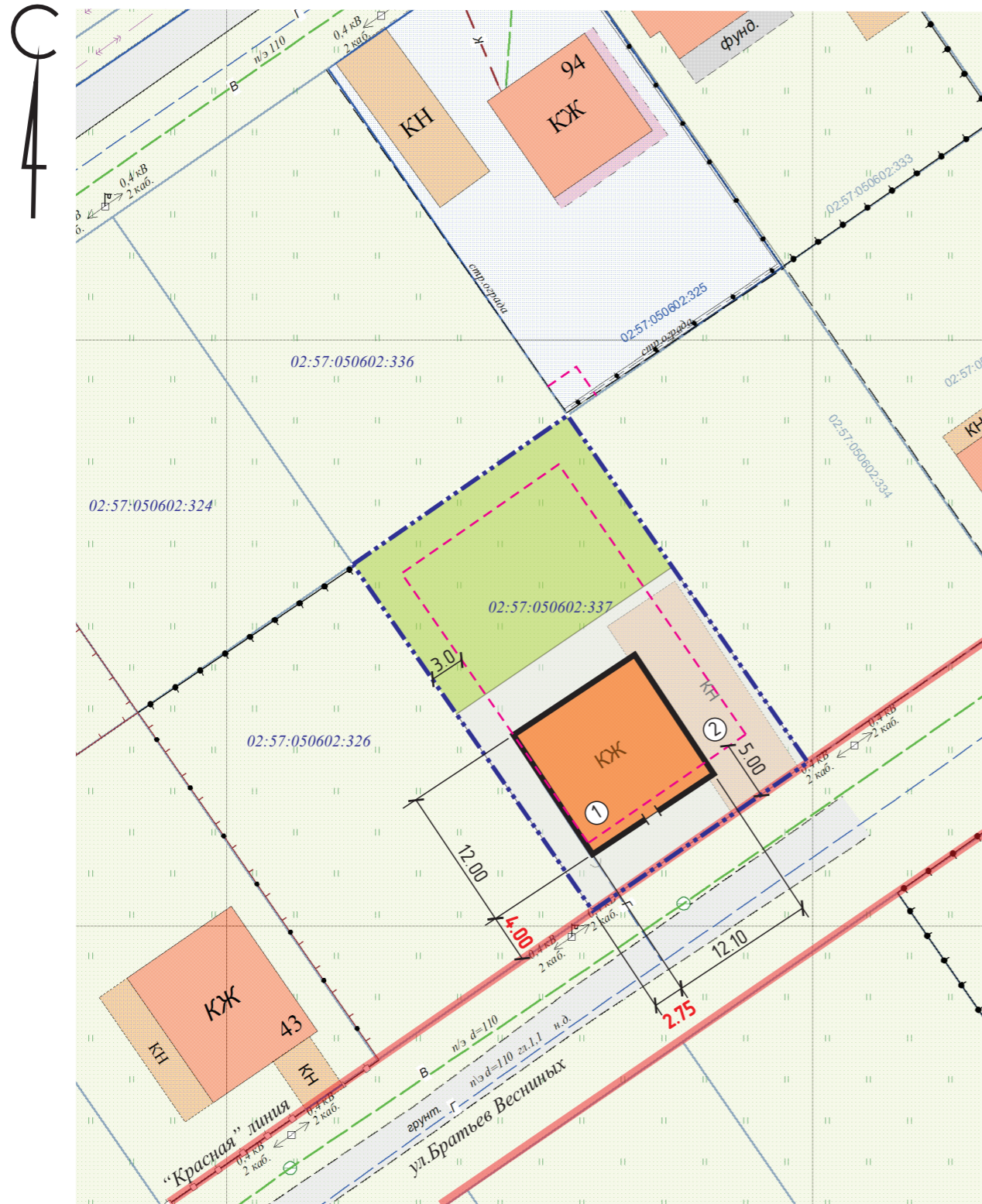
СХЕМА ПЛАНИРОВОЧНОЙ ОРГАНИЗАЦИИ ЗЕМЕЛЬНОГО УЧАСТКА. М1:500